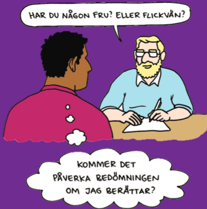
Bild från "Bra bemötande av hbtq-personer." Illustratör: Bitte Andersson