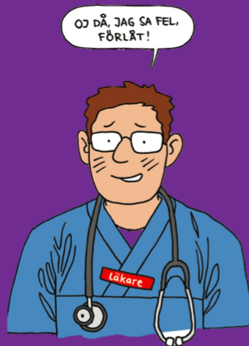
Bild från "Bra bemötande av hbtq-personer." Illustratör: Bitte Andersson